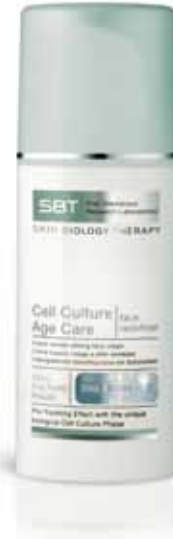
Cell Culture Age Care | face redefiner

Eine faltenglättende Gesichtspflege mit Soforteffekt: Feine Linien und Falten erscheinen gemildert, die Haut ist optimal befeuchtet und sanft gestrafft, so dass sie praller und strahlender erscheint.