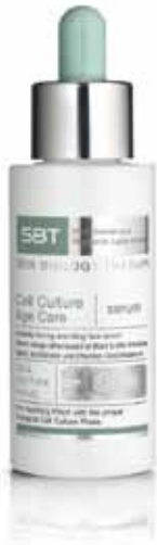
Cell Culture Age Care | serum

Ein leichtes und hochkonzentriertes Gesichtsserum für ein einzigartiges Hautgefühl. Es verleiht der Haut neue Spannkraft und eine verbesserte Elastizität: intensiv festigend und langfristig straffend.