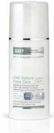
Cell Culture Face Care | extra light

Ein mattierendes Creme-Gel. Ideal bei unreiner, öligter Haut oder für alle, die beinahe ölfreie Pflegeprodukte vorziehen.