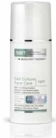
Cell Culture Face Care | light

Ein mattierendes Creme-Gel. Ideal bei unreiner, öligter Haut oder für alle, die beinahe ölfreie Pflegeprodukte vorziehen.