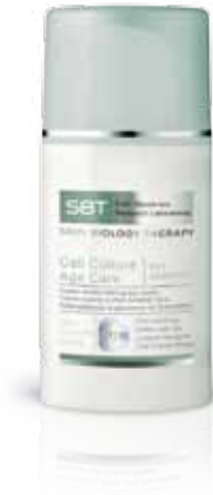
Cell Culture Age Care | eye redefiner

Eine faltenglättende Augenpflege: strafft, glättet und stärkt sofort und langfristig die empfindliche, anspruchsvolle Augenpartie. Für jeden, der speziell Haut um die Augen vor den Zeichen der Hautalterung schützen möchte.