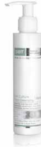
Cell Culture Face Cleansing | liquid

SBT Skin Biology Therapy bietet acht verschiedene Reinigungsprodukte in unterschiedlichen Texturen. Wählen Sie je nach Hautzustand, Bedürfnis und Vorliebe ihre individuelle Reinigung.