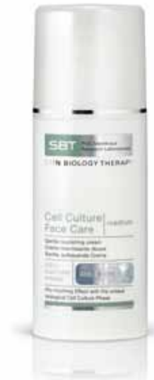
Cell Culture Face Care | medium

Eine leichte Emulsion. Ideal bei zu Glanz neigender Haut oder bei geringem Lipidbedarf. Sehr angenehm unter dem Make-up.