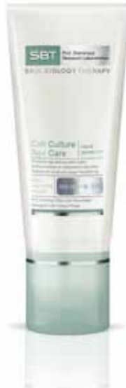
Cell Culture Age Care | hand protector

Eine schützende Handcreme mit SPF 10 gegen Hautalterung: pflegt und befeuchtet intensiv und gibt der Haut ihre Elastizität zurück. Wirkt der Entstehung von Pigmentflecken nachhaltig entgegen.